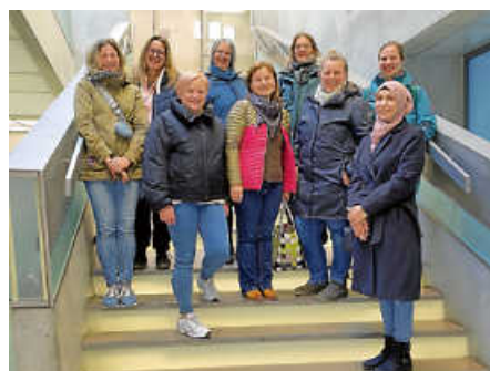
Ostfilderner Tageseltern

Am 17. April beschloss der Gemeinderat die Erhöhung der Platzpauschale pro Kind auf 100 Euro.