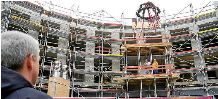
Christof Bolay verfolgt die Zeremonie des Richtfestes.

Im Rahmen des ersten Bauabschnitts entsteht in Ruit ein neuer Bettentrakt mit 150 Ein- und Zweibett-Zimmern. Dieser wird als eine Art Brückenbau über der Strahlentherapie positioniert und beherbergt neben den Patientenzimmern auch moderne Sprechstundenräume sowie eine urologische Funktionseinheit. Zudem wird die Strahlentherapie im Untergeschoss erweitert und die Nuklearmedizin erhält eine räumliche Neugestaltung. eis