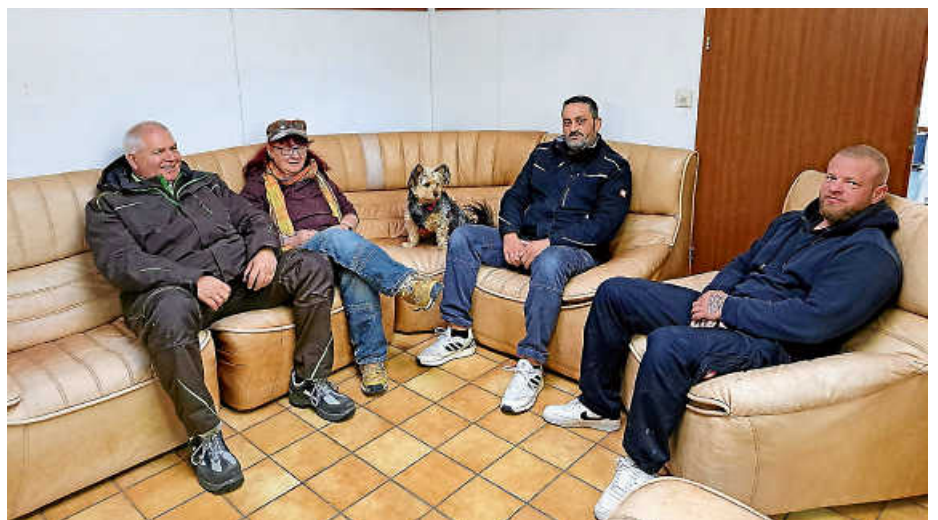
Das Hausmeisterteam beim Probesitzen.

Die Soziale Beratung der Flüchtlinge setzt sich vielfältige Ziele, darunter die Förderung der Integration, die Begleitung in allen Alltagsfragen sowie die Sicherstellung des sozialen Friedens in der Unterkunft und deren Umfeld. Zusätzlich bietet sie psychosoziale Beratung und Begleitung bei Problemen an und dient als erste Anlaufstelle für Informationen und Vermittlungsdienste für alle Geflüchteten. Durch die enge Zusammenarbeit mit externen Partnern wie dem Freundeskreis Asyl wird zudem aktiv die Teilhabe gefördert und der soziale Zusammenhalt gestärkt.