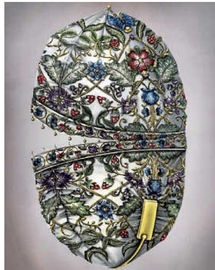
Larva 2024 / II Foto: Mona Ardeleanu

Am letzten Sonntag wurde die Ausstellung „Mona Ardeleanu – Ceres“ erfolgreich eröffnet. Die Ölmalerin der Stuttgarter Künstlerin überrascht stets aufs Neue. Nichts ist so, wie es auf den ersten Blick zu sein scheint. Wir laden herzlich zur Erkundung ein. Wegen kurzfristig angesetzter dringender Wartungsarbeiten am Stromnetz muss die Galerie am Samstag, 4. Mai, leider geschlossen bleiben.