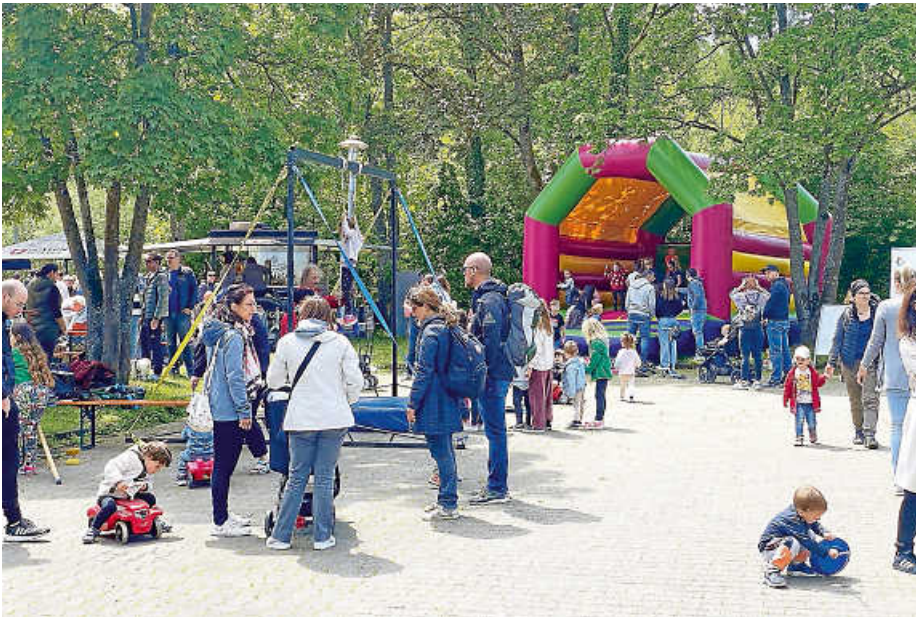
Groß und Klein genießen das Familienfest.