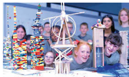
Die 5b unterstützt den Bau eines Wasserturms in Benin.