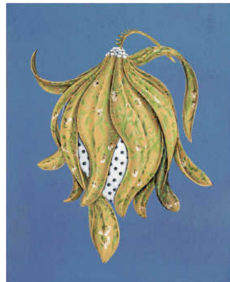
Core III, 2024

Der Titel „Ceres“ spiegelt die verschiedenen Bedeutungsebenen in den Arbeiten wider. Ceres ist die römische Göttin der Fruchtbarkeit und auch der Name des größten Zwergplaneten im Asteroidengürtel."