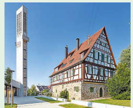
Pfarrhaus und Kirche

Stadtarchivar Jochen Bender führt durch Ruit. Die Führung bietet alte Gemäuer wie den Hirschkbogen oder das evangelische Pfarrhaus. Es geht aber auch um Sanierungskonzepte und die spannende Geschichte von Sportschule und Waldheim. Beim Eichenbrunnen erlebt man eine weite Aussicht auf die Umgebung. Der Waldheimverein Ruit lädt zu dieser Führung ein.