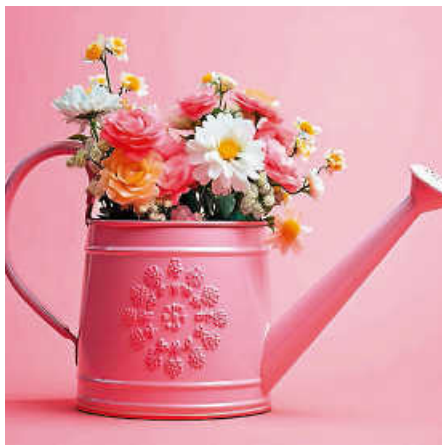
Der Gartenraum ruft. Grafik: Heidinger

Verschiedene Leckereien sind ebenso im Angebot wie Mitmachangebote für Kinder und Erwachsene. Die Obst- und Gartenbauvereine in Ostfildern informieren zur Streuobstwiese und zu Gärten auf kleinem Raum und bieten eigene Erzeugnisse an. Die Kräuterpädagogen informieren über Wildkräuter und bieten Kräuterspaziergänge