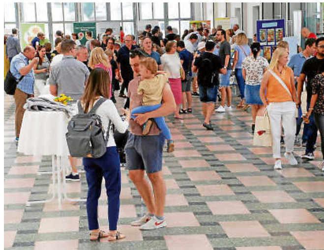
Rund 160 Gäste kamen zum Neubürgerempfang.

In den vergangenen zwölf Monaten sind 1.774 Erwachsene nach Ostfildern gezogen. Die Stadt hat ihre neuen Bürgerinnen und Bürger bei einem Empfang begrüßt.