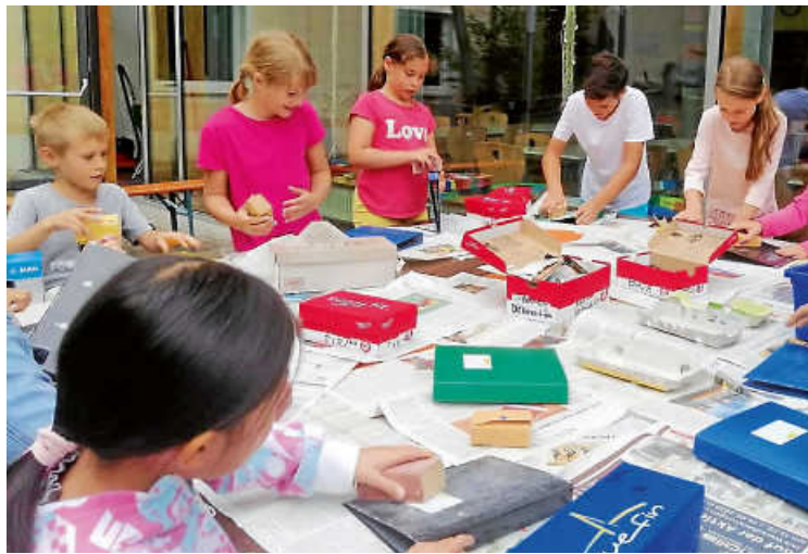
Kinder erhalten bei vielen Angeboten Ermäßigungen.

► Anträge auf einen Ostfildernpass für das Jahr 2024 gibt es ab November im Stadthaus im Scharhauser Park beim Bürgerservice und online unter www.ostfildern.de .