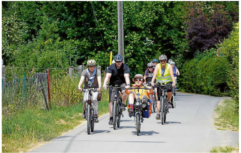
Beim Auftakt wurden die ersten Kilometer gesammelt.