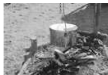
Kochen über dem Feuer beim Camp

Die Regeltreffen finden über die Sommerferienzeit nicht statt, das nächste Treffen wird am 16. September sein.