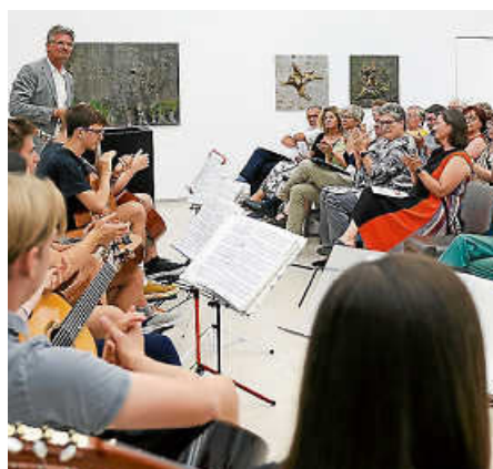
Gut besuchtes Stifterforum