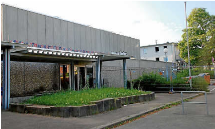
An der Sporthalle Kemnat wird gearbeitet.