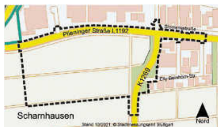
Karte: FB3 / Planung

Die Grenzen des vorgesehenen Geltungsbereiches des Bebauungsplans sind in dem abgebildeten Kartenausschnitt dargestellt. Maßgebend ist der Lageplan des Fachbereiches 3 / Planung der Stadt Ostfildern vom 09.09.2021.