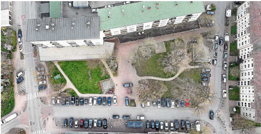
Der Herzog-Philipp-Platz aus der Vogelperspektive.