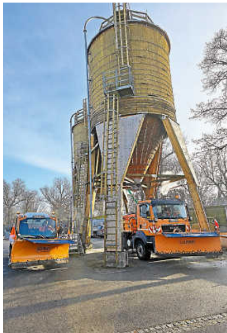
Winterdienstfahrzeuge beim Aufladen des Streuguts.

Besondere Aufmerksamkeit gilt an solchen Tagen der gegenseitigen Unterstützung in der Nachbarschaft. Ältere oder körperlich beeinträchtigte Personen sind oft nicht in der Lage, ihrer Verpflichtung nachzukommen. Hier können Nachbarn durch kleine Hilfen, wie das Räumen eines Gehwegs oder das Streuen eines Zugangs, einen wichtigen Beitrag leisten. Diese Form des nachbarschaftlichen Zusammenhalts war vergangene Woche vielerorts in Ostfildern zu beobachten. eis