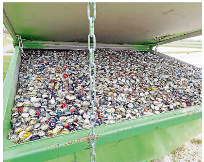
Ein Container voller Kronkorken ermöglicht eine Spende für krebskranke Kinder.