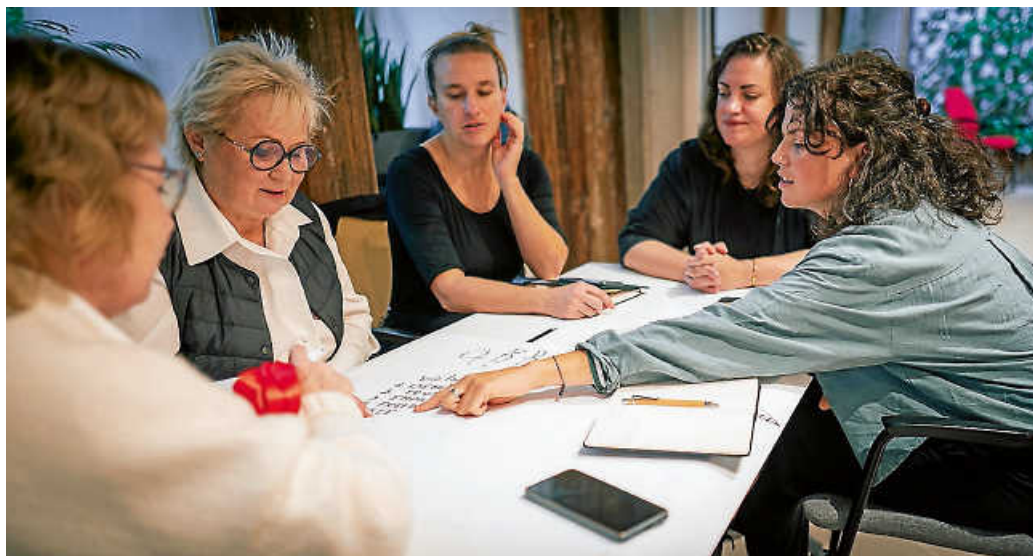
Planung für das Projekt „Bridges“ in Warschau.