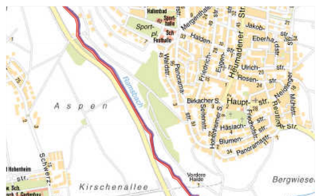
Sperrung am Ramsbach

► Die Anmeldung muss bis zum 30. September an service.tiefbauamt@stuttgart.de beim Tiefbauamt der Stadt Stuttgart erfolgen. Der Betreff der E-Mail sollte „Kennzahl 66-8.15/Szilagi“ lauten.