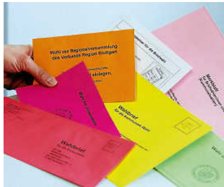
Am Sonntag wird gewählt.

Sollte eine Wahlbenachrichtigung nicht mehr auffindbar sein, kann man sich beim Wahlamt erkundigen, welchem Wahllokal man zugeteilt ist. Dort genügt dann am