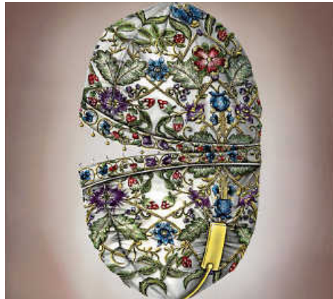
Eines der Werke in der Ausstellung

► Ausstellung „Ceres“, bis 25. Juni in der städtischen Galerie im Stadthaus, Gerhard-Koch-Straße 1. Eintritt frei. Öffnungszeiten: Dienstag und Donnerstag 15 bis 19 Uhr, Samstag 10 bis 12 Uhr, Sonntag 15 bis 18 Uhr, feiertags geschlossen. Informationen gibt es unter ostfildern.de/galerie .