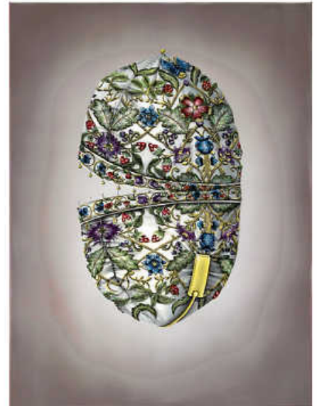
Lava 2024 / II, 2024

in der Galerie zu bestaunen ist, erst durch den Blick der Menschen, der es betrachtet und die eigenen Assoziationen und Interpretationen einbringt. Wo ist das Gürteltier? Sind es Tierschuppen oder doch Artischockenblätter? Was verhüllt der dekorative Stoff? Ein Tier? Oder ist er ein Sitzkissen? All das gehört eigentlich nicht zusammen und bildet doch eine harmonische Einheit von Formen, Farben und Mustern. Aber dahinter könnten auch die Abgründe lauern. Man kann es beim Betrachten bei der Wahrnehmung der Schönheit der Oberfläche belassen, oder etwas genauer hinsehen und Unheimliches entdecken.