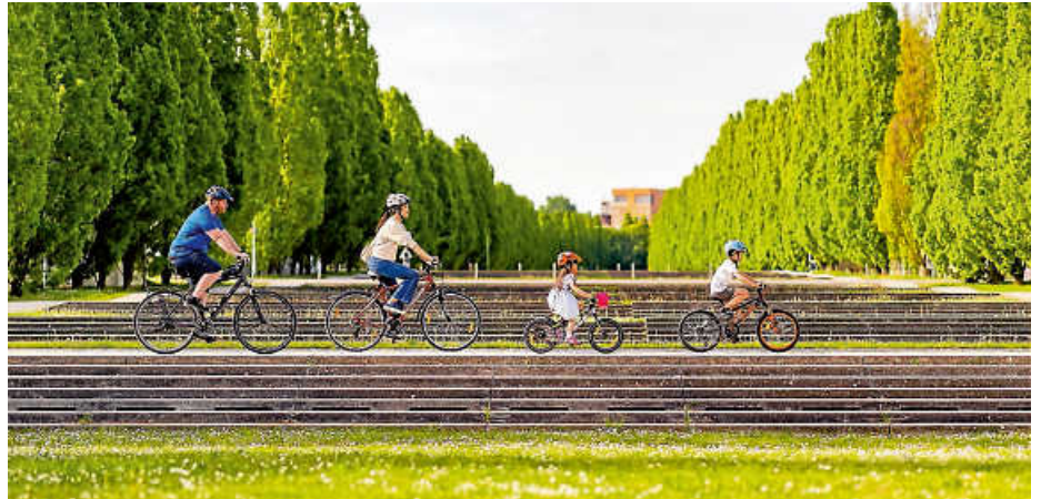
Gemeinsam Radkilometer sammeln