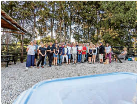
Gruppenbild Elba 2024

Alle sind wohlbehalten von einem sehr schönen Elba-Tauchurlaub zurück. Gruppenbild mit unseren Gastgebern von „omnisub“.