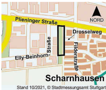
Plan: FB 3 / Planung

Die Grenzen des vorgesehenen Geltungsbereiches des Bebauungsplans sind in dem abgebildeten Kartenausschnitt dargestellt. Maßgebend ist der Lageplan des Fachbereichs 3 / Planung der Stadt Ostfildern vom 11. April 2024.